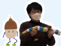
わらべ歌・手遊び