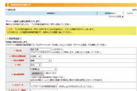
マイページ登録画面