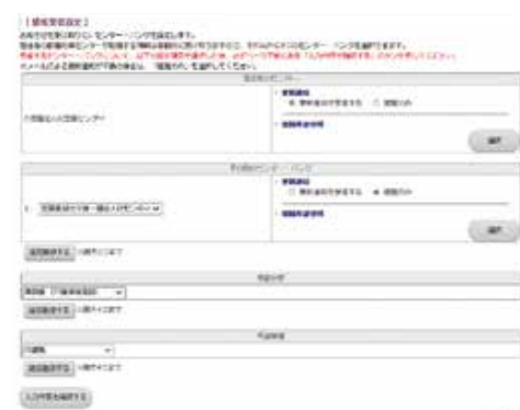
マイページログイン画面