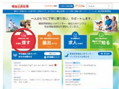
「福祉のお仕事」トップページ