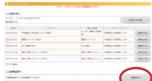
仕事を探すボタン