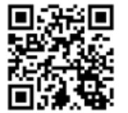
保育士・保育所 支援センター Facebook

《問い合わせ先 福祉人材部（鳥取県保育士・保育所支援センター） 0857-59-6342》