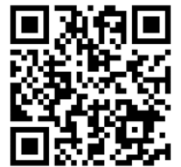
福祉人材センター Instagram

《問い合わせ先 福祉人材部（鳥取県福祉人材センター） 0857-59-6336》