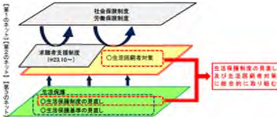
図表1 第2のセーフティネットの拡充のイメージ

法は、生活保護に至る前の段階の自立支援策の強化を図るため、必須事業として自立相談支援事業、住居確保給付金の支給を、任意事業として就労準備支援事業、一時生活支援事業、家計改善支援事業、子どもの学習・生活支援事業等を制度化している。事業の実施主体は、福祉事務所設置自治体であり、それぞれの事業を直接又は委託により実施する。