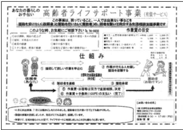
▲高齢者ライフサポート事業のチラシ。高齢者訪問活動でも配布し、困りごとの聴き取りにつなげる