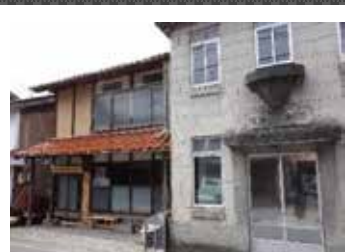
▲レトロな雰囲気、カメラを向ける人も多い

瓦屋根の和風な民家と、棟続きの時代がかった洋風建築。もともと歯科医院の建物で、昭和2年に建てられたものという。現在社協の介護サービス部門の事業所になっている石造りの建物の壁には、右書きで刻まれた当時の院名がそのまま残り、往時の姿を思わせている。